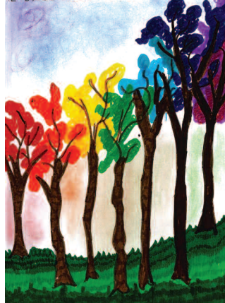
IL BOSCO DELLA PACE