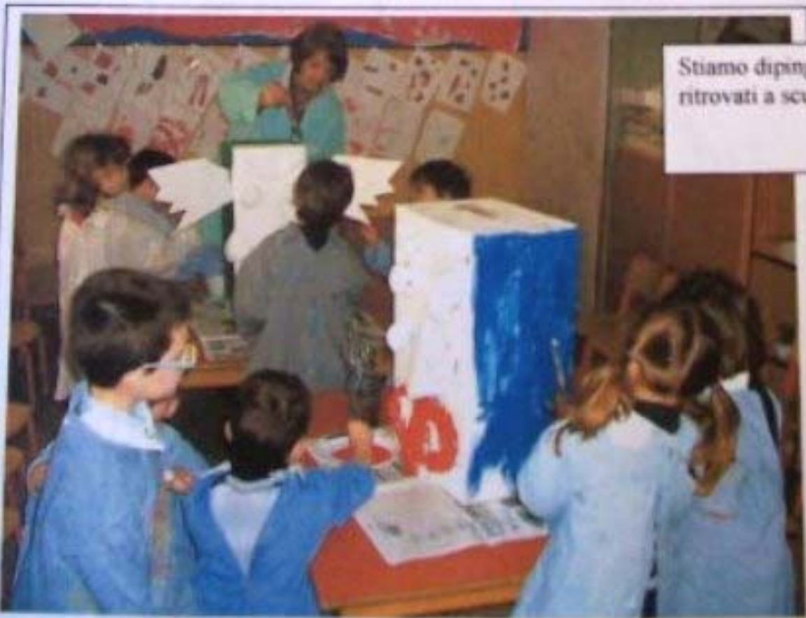
Stiamo dipingendo i pezzi di totem ritrovati a scuola....

E non solo, sparsi per le aule c'erano dei "pezzi" bianchi di qualcosa...che fossero i pezzi di un Totem indiano? Dietro al cartello "Augh" abbiamo trovato questo messaggio: " UCCELLACCIO QUI VOLARE E POI SVELTO VIA SCAPPARE, I COLORI A NOI RUBARE...VOI AIUTARE?"